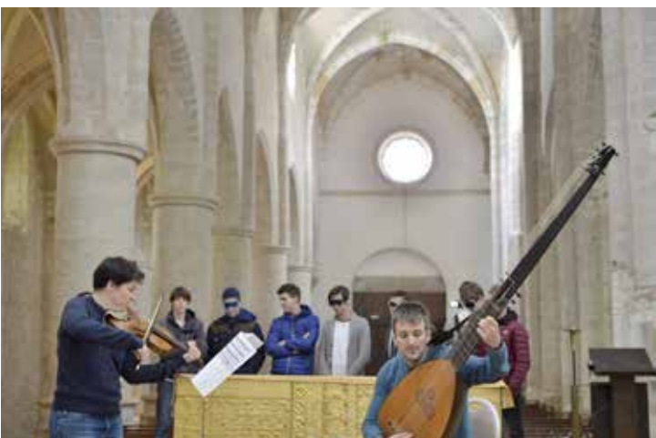
Actions de sensibilisations culturelles des années 2013, 2014, 2015 et 2016.