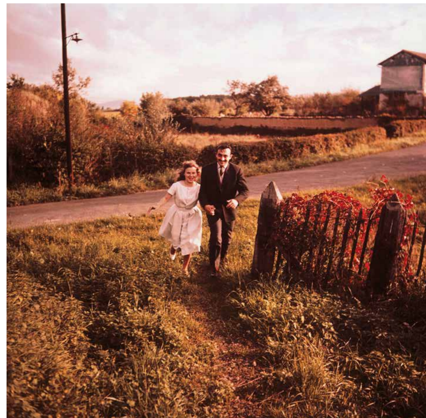
Photo : La ferme du Gare, Villefranche-sur-Saône, France, 1960